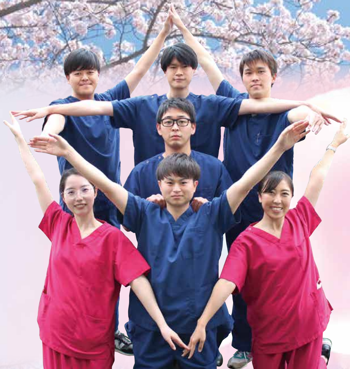
令和6年度の初期臨床研修医